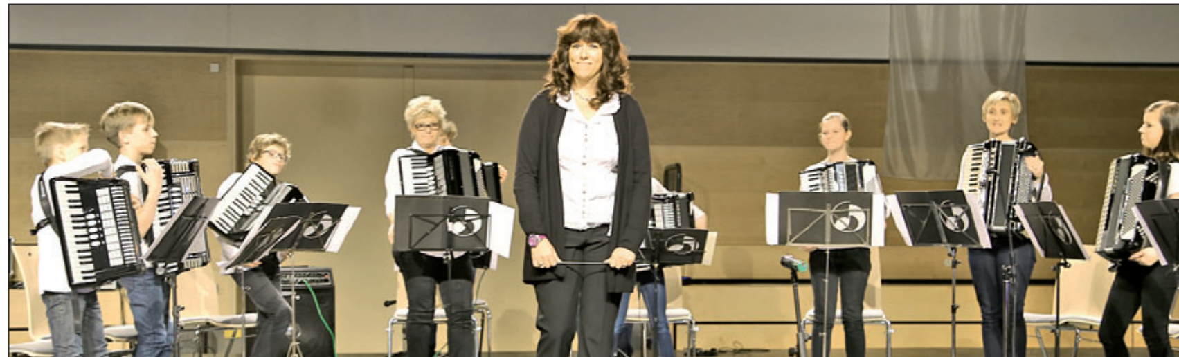
Das Akkordeonorchester der Musikschule im Bildungszentrum spielte ein Programm mit populärer Musik.