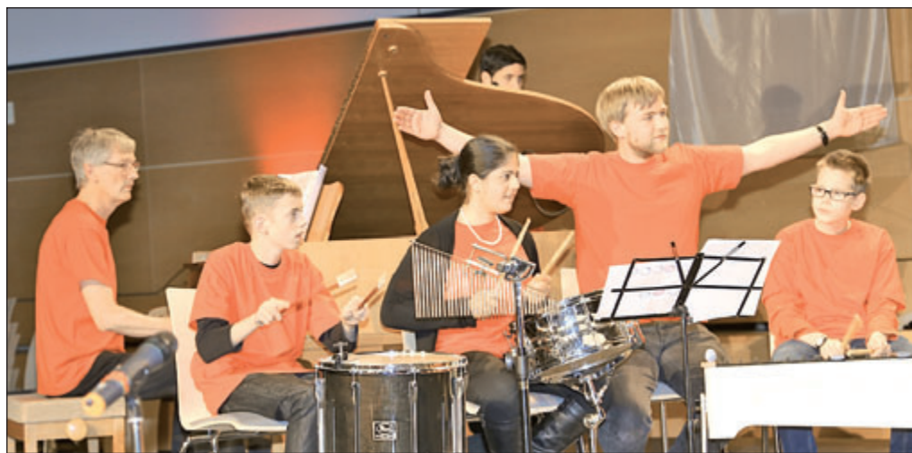
Schülerinnen und Schüler der Sekundarstufen 1 und 2 der Peter-Räuber-Schule inszenierten »Aus der neuen Welt«, eine musikalische Collage in Anlehnung an Anton Dvoraks 9. Sinfonie.