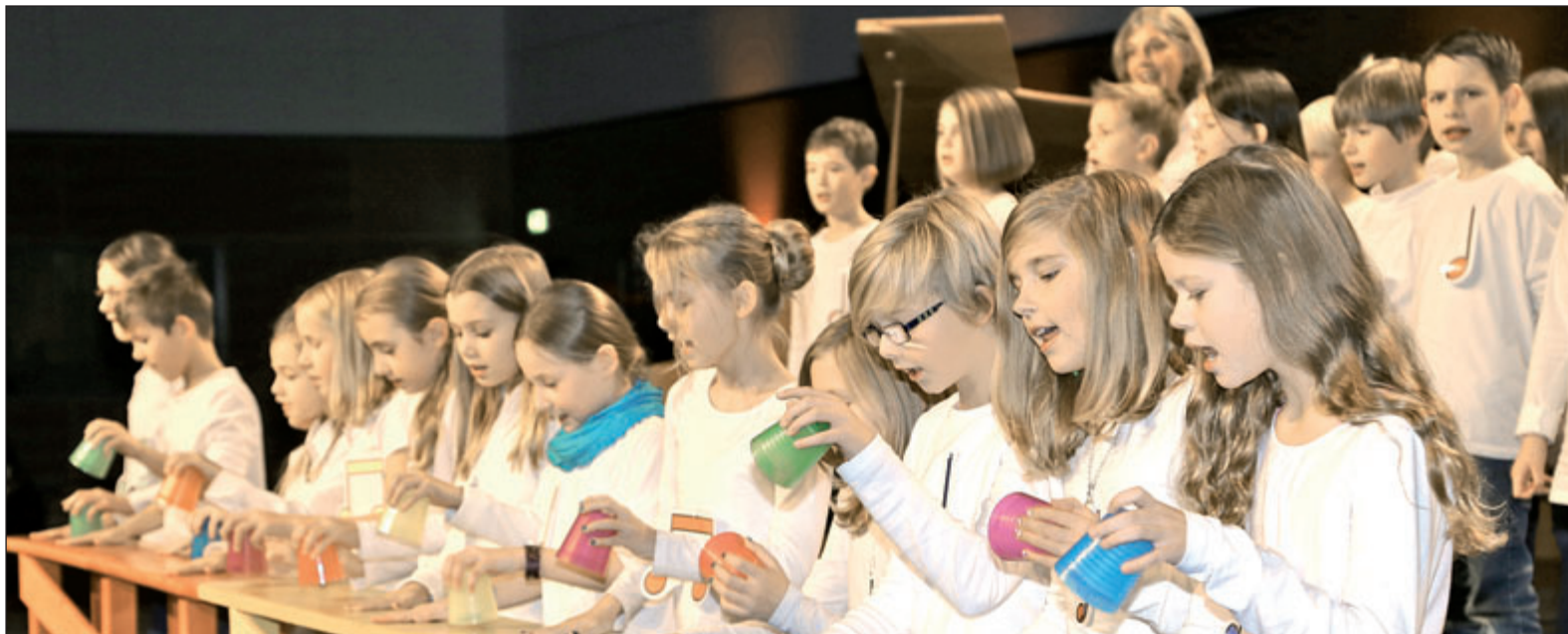
Die Grundschule Denkte und die Bläserklasse 6b des Theodor-Heuss-Gymnasiums spielten »Shalala« – auch auf ungewöhnlichen Instrumenten.