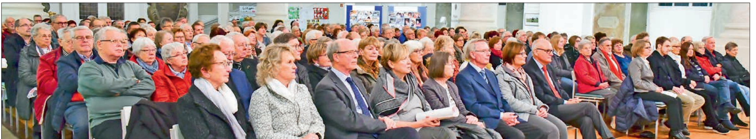
Rund 400 Zuhörer waren gekommen, um sich das Konzert des Polizeiorchesters Niedersachsen anzuhören.