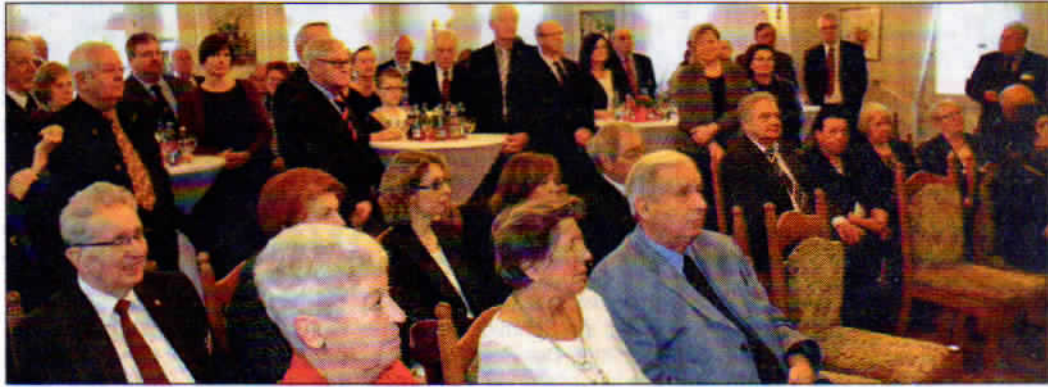
Blick in den gefüllten Saal